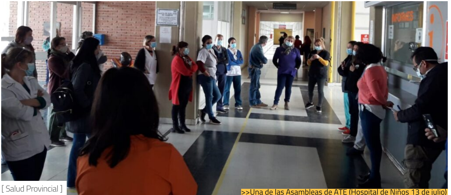
[ Salud Provincial ]