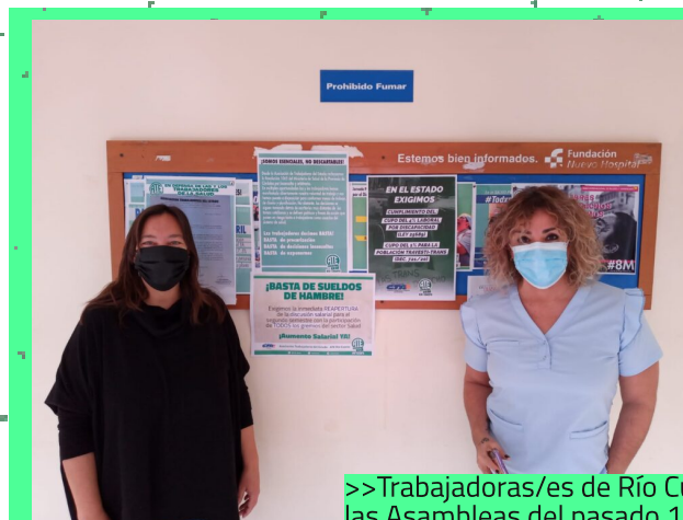
>>Trabajadoras/es de Río Cuarto (izq.) y de Villa Dolores (der.) en las Asambleas del pasado 13 de julio.

sigue sin efectivizarse, hay compañeras y compañeros que están cobrando por debajo de la canasta básica y la mayoría por debajo de lo que ha establecido el INDEC. Además, hay formas de contratación no acorde a lo que la ley contempla como trabajo digno. Tenemos compañeros y compañeras con sueldo que están conformados por sumas no remunerativas. Y también está la cuestión de las recategorizaciones", finalizó. También se registraron masivas asambleas en el Hospital Tránsito Cáceres de Allende, el Misericordia y Hospital Provincial de Río Tercero, todos enroladas en el unánime reclamo por la reapertura de paritarias.