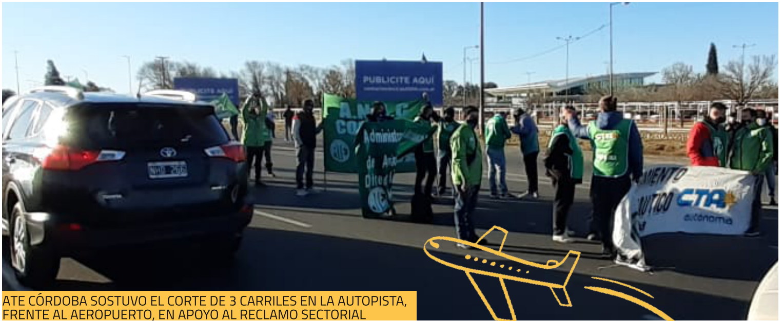
ATE CÓRDOBA SOSTUVO EL CORTE DE 3 CARRILES EN LA AUTOPISTA, FRENTE AL AEROPUERTO, EN APOYO AL RECLAMO SECTORIAL